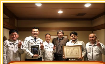
株式会社 E空間 殿