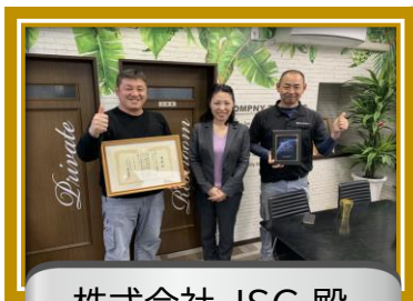
株式会社 JSC 殿