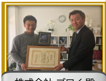
株式会社 ブロイ 殿

キャンペーンにご参加頂いた 全国の認定施工店様に心から 御礼申し上げます。スタッフ一同